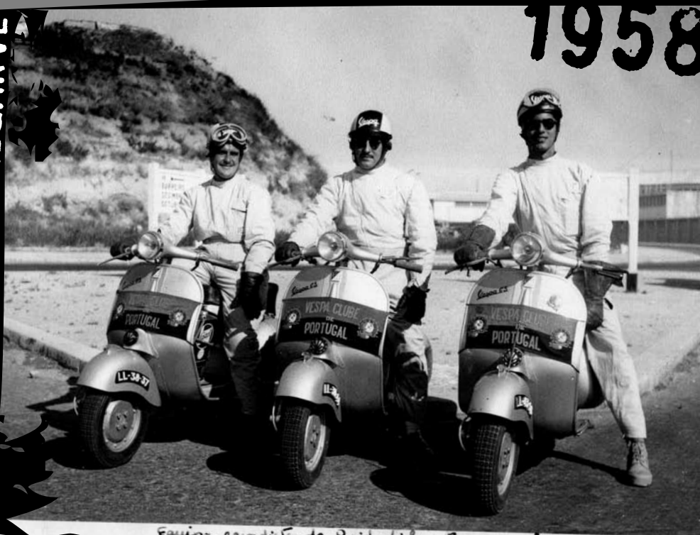
Equipa vencedora do Raid Lisboa-Faro 3h-56-15